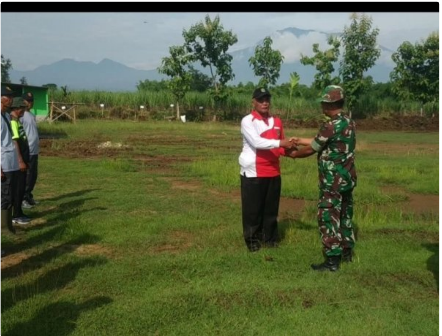
Jaga Kelestarian Alam Kodim 0804/Magetan Tanam 1.950 Bibit Pohon Sukun

Magetan – Sebagai bagian dari upaya menjaga kelestarian lingkungan dan