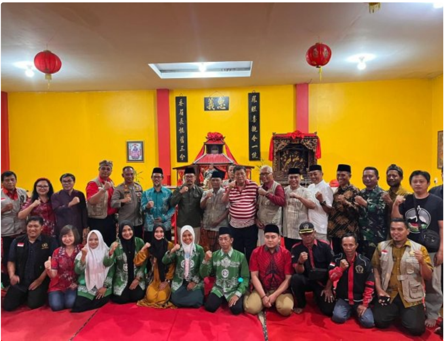
Danramil 0804/01 Magetan Bersama Forkopimca Hadiri Kegiatan Do'a Bersama Peringati Imlek Tahun Baru Saka 2576/2025